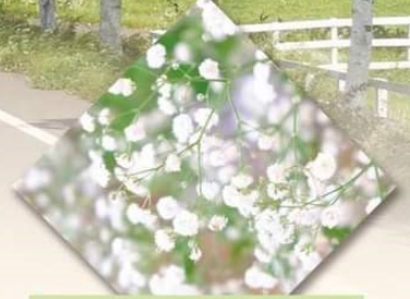
北海道でも有数の かすみ草の産地！