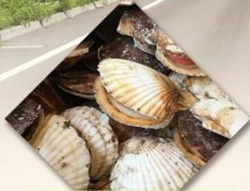
ホタテの耳づくり養殖が 盛んな漁師町！