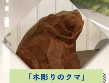
「木彫りのクマ」 発祥の地！